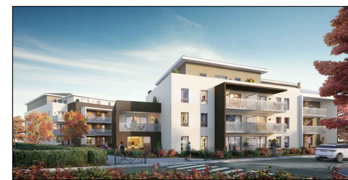
Bâtiment B - R+2